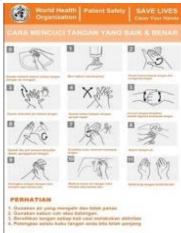
Gambar 1: Langkah-langkah mencuci tangan yang baik dan benar

Dari hasil observasi yang dilakukan saat study pembelajaran yang dilaksanakan di salah satu SLB di Kabupaten Malang ditemukan kasus yaitu beberapa siswa yang setelah menggunakan crayon, sebelum makan atau setelah makan mereka mencuci tangan, tetapi cara mencuci tangannya kurang tepat. Akibat yang ditimbulkan jika kita tidak mencuci tangan dengan benar antara lain kuman atau kotoran yang ada ditangan kita tidak akan hilang. Jika kuman masih menempel pada tangan kita akan mengakibatkan gangguan kesehatan seperti diare, cacangan, atau infeksi pada kulit.